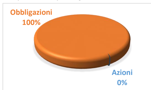
Composizione del portafoglio al 31.12.2020

Il rendimento riflette gli oneri gravanti sul patrimonio del comparto e non contabilizzati nell'andamento del benchmark.